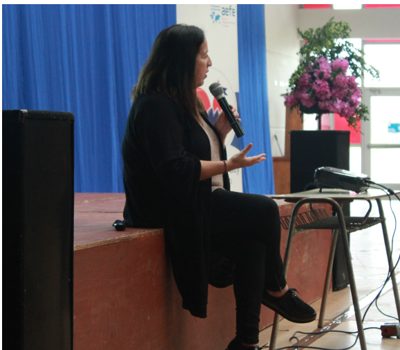
Charla colegio Osorno