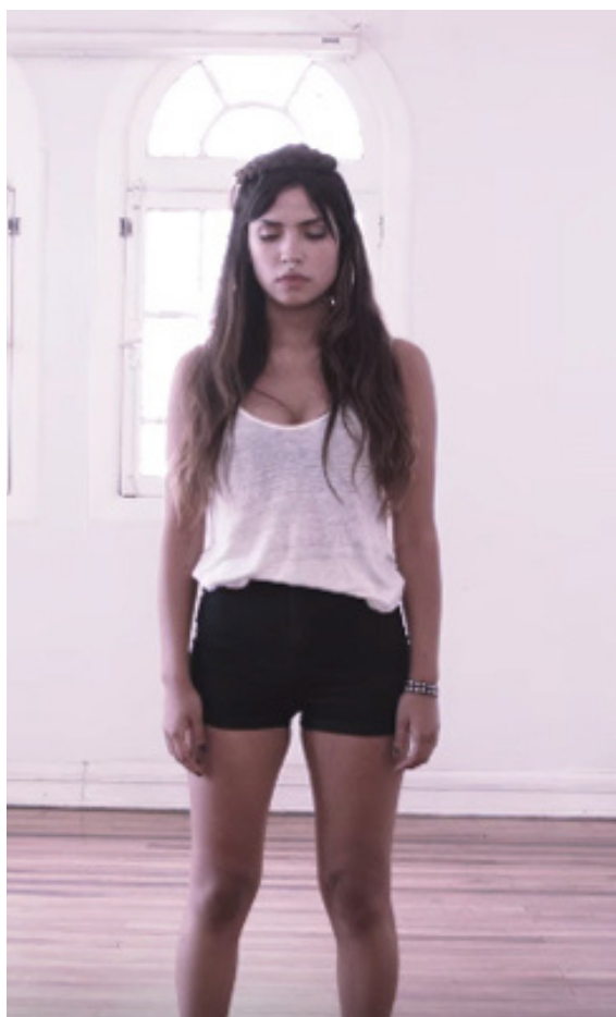
Video "Que nadie apague tu luz"