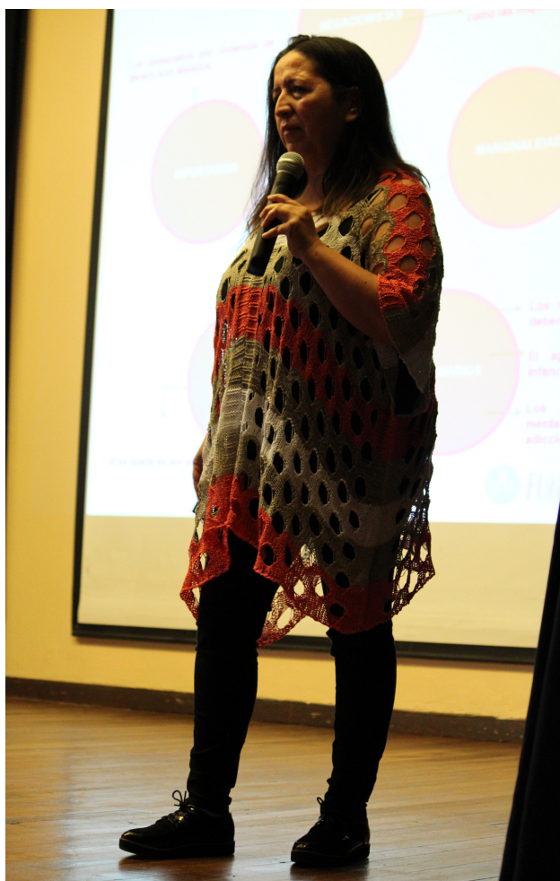
Charla Universidad Santo Tomás

Llegando a más de 9.497 personas , entre ellos jóvenes, adolescentes, profesores, padres y profesionales, con nuestro mensaje sobre la violencia en el pololeo.