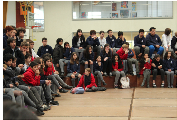
Charla colegio Osorno