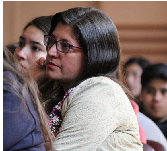
Charla Colegio Anita Talcahuano