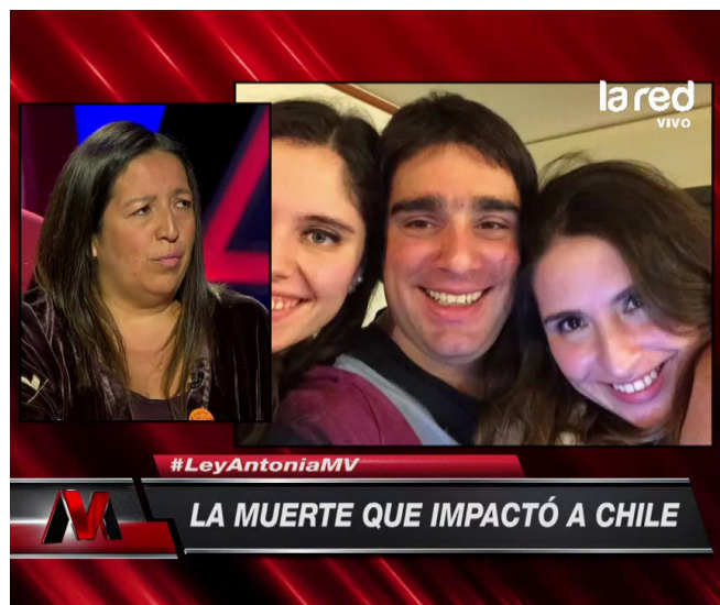
Programa Mentiras Verdaderas.