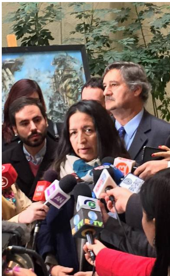
Presentación Proyecto de Ley 7F en el Congreso.

Este 9 de noviembre, luego de una campaña comunicacional nacional, entró en su primer trámite constitucional, donde fue discutida en la Cámara de Diputados y fue aprobada de manera unánime. Pasando así a la Cámara de Senadores para ser discutida.