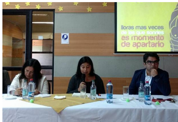
Primera charla - abril 2017.