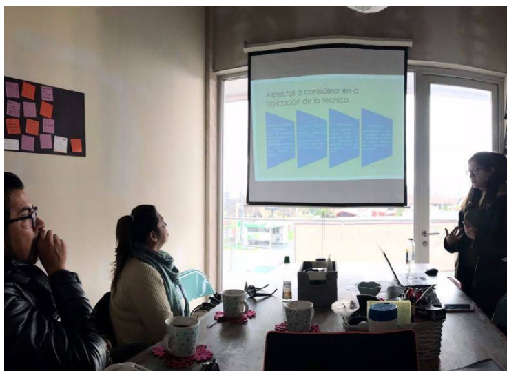
Reunión de equipo en nuestra oficina.