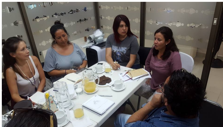
Primera reunión en Working Place Concepción.