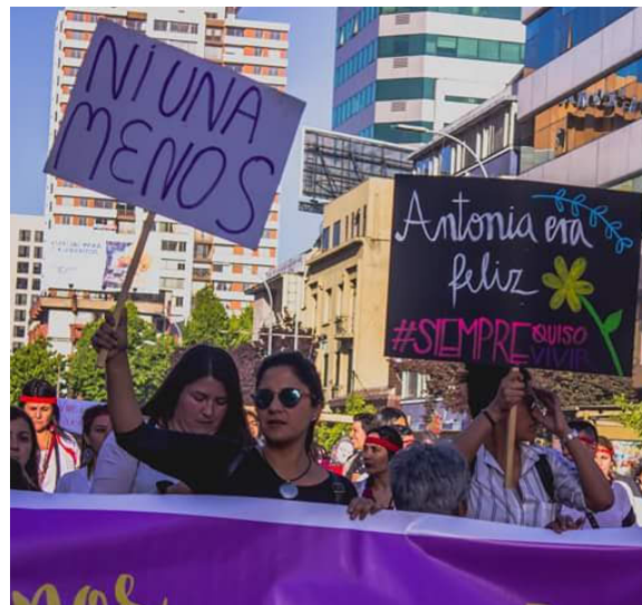
Primera marcha en Concepción.

Cientos de penquistas marcharon para exigir la promulgación de una Ley Antonia , que regulara los casos de violencia física y psicológica entre pololos y ex pololos sin convivencia. Como también, la figura de inducción al suicidio.