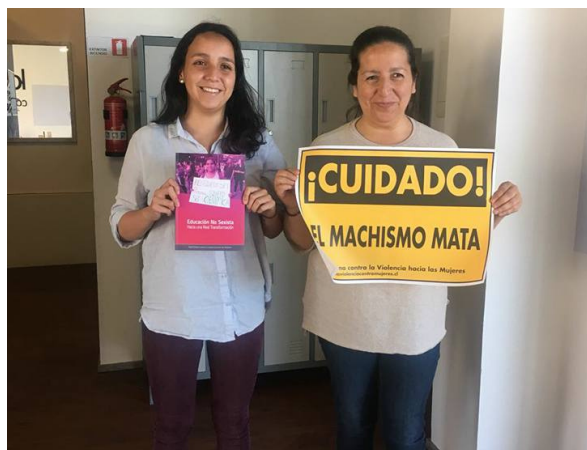
Primera marcha en Concepción.