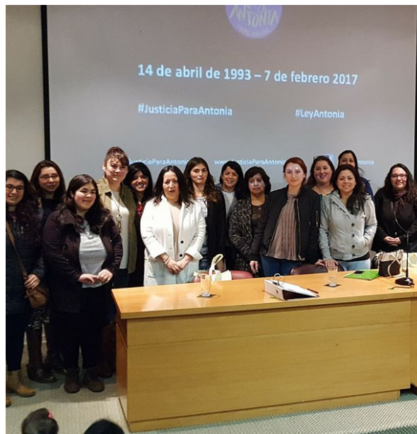
Charla Justicia Para Antonia.