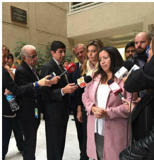
Punto de prensa presentación Ley Antonia.